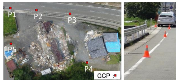
図 5 GCP の配置図と使用した標定点