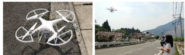
図2 使用した UAV と操縦の様子