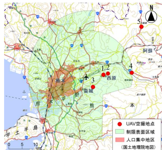
図1 UAVによる観測調査地点及び飛行制限区域

使用した UAV は、図2に示す4回転翼の小型マルチコプター Phantom 3 Professional (DJI 社製)である。総重量は 1280g、搭載カメラは Sony EXMOR 1/2.3"で、4K 動画または 12.4M ピクセルの高画質静止画の撮影が可能である。飛行高度は地上約 40m で、手動操縦による空撮を行った。